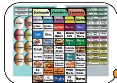
Exemples de claviers