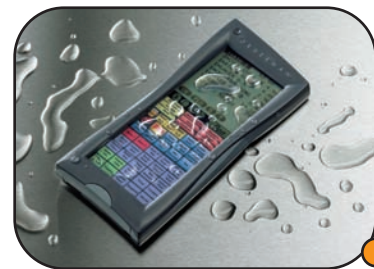
Résiste aux projections d'eau